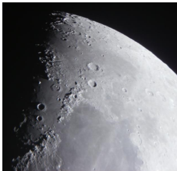
Foto 2: Particolare della Luna con Appennini (sotto), Caucaso (centro) e Aristotele

Saranno previste delle giornate per l'osservazione del Sole con appositi filtri (Herschel in luce bianca e Idrogeno alfa "H \alpha " per le protuberanze).